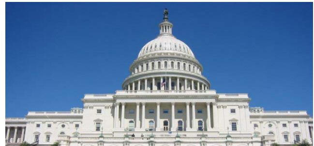
Capitol Hill, Washington DC

En materia energética, y dentro de este mismo plan los nuevos representantes votaron ayer, jueves 18 de enero con una mayoría de 264 a 163 (incluyendo a 36 congresistas republicanos) la eliminación de los subsidios y las exoneraciones fiscales otorgadas a las grandes empresas petroleras en el 2004 y entre 1998 y 1999. Adicionalmente, esta ley prohibiría otorgarle nuevas concesiones a empresas petroleras que no estén dispuestas a renegociar las regalías que les fue-