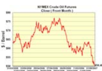
Evolución de los precios de los futuros de crudo NYMEX entre el 3/1/07 y 18/1/07

Muchos analistas están especulando sobre una posible devaluación del Bolívar debido a esta reducción.